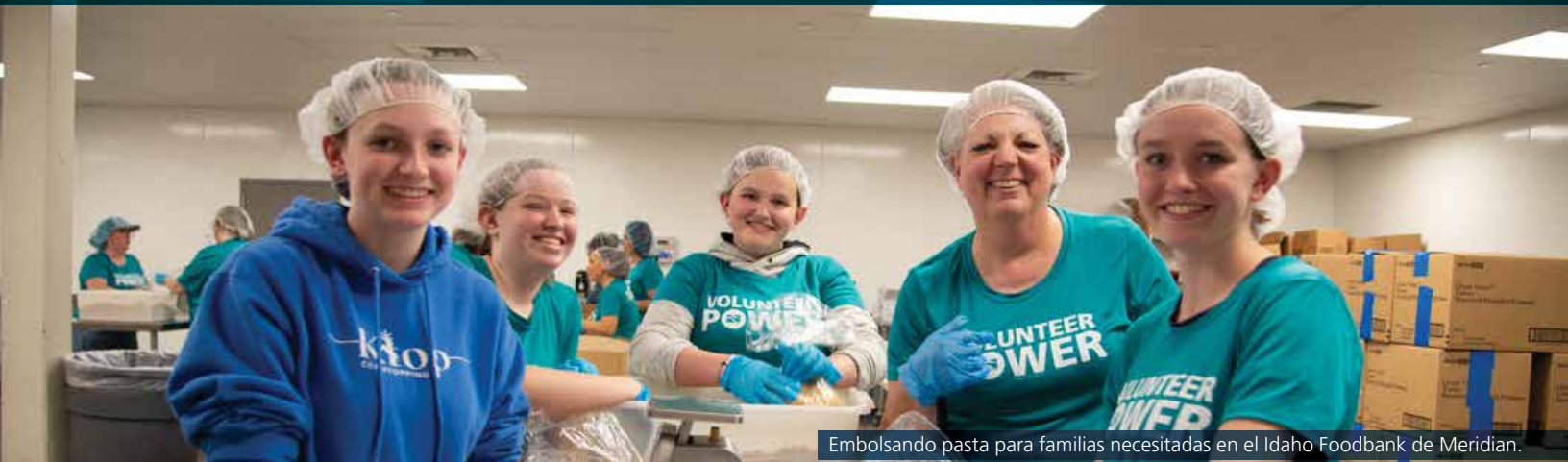
Embolsando pasta para familias necesitadas en el Idaho Foodbank de Meridian.