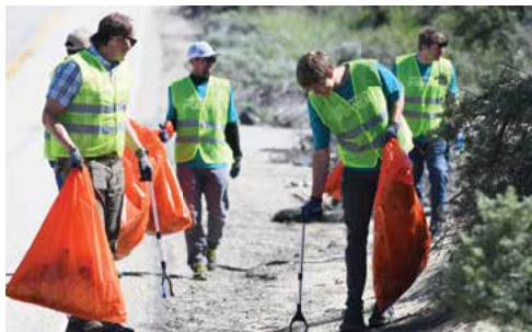
Recogida de basura a lo largo de nuestro tramo «Adopte una Carretera» del Bogus Basin Road de Boise.

En 2022, Idaho Power fundó una tradición llamada «Día del Poder de la Comunidad», la cual les brinda la oportunidad a los empleados de unirse para participar en proyectos de servicio voluntario en toda nuestra área de servicio. Decenas de empleados y familiares salieron a disfrutar de las festividades más recientes. Estos son algunos de los proyectos en los que trabajamos durante el Día del Poder de la Comunidad en la Primavera de 2024.