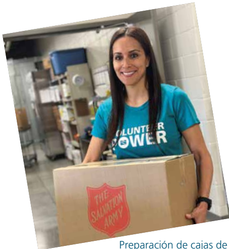
Preparación de cajas de ayuda para el Ejército de Salvación de Boise.