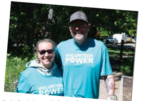
Embellecimiento de los jardines del MK Nature Center de Boise.