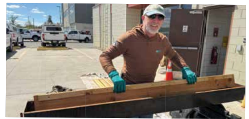
Ayuda en la elaboración de 20 camas para Sleep in Heavenly Peace de Twin Falls.