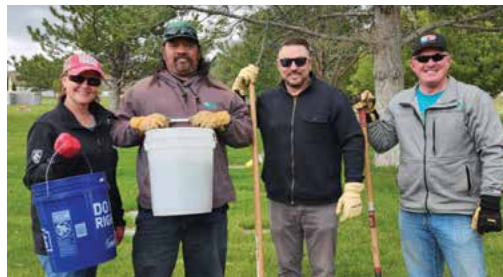
Trabajos de recorte y podada en el Cementerio Restlawn de Pocatello para el Día de la Recordación (Memorial Day).