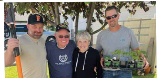
Limpieza del patio de un veterano local de Fruitland.

Para saber más sobre lo que hace Idaho Power para devolverle algo a nuestras comunidades a través de donativos, servicio voluntario y educación, visite idahopower.com/community .